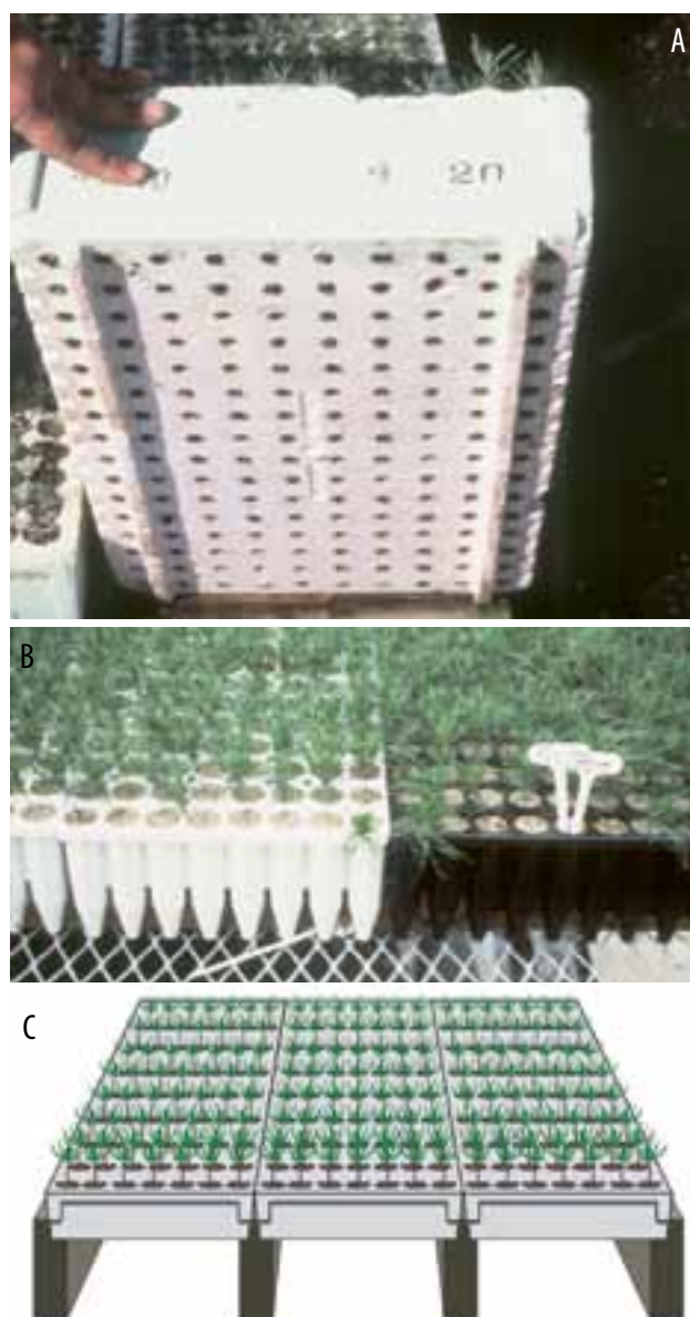
Figura 3. Para promover la poda de raíces la base de las celdas de las bandejas tienen distintos sistemas de apoyo para que las aberturas queden al aire. A) Bandeja con dos costillas basales sobre la que se apoya. B) Bandeja apoyada sobre un enrejado metálico. C) Bandeja apoyada solo sobre sus vértices más largos en soportes sólidos (Fotos: Thomas D. Landis, ilustración: Jim Marin).

Los contenedores deben tener un orificio inferior suficientemente grande para facilitar un buen drenaje y la poda de la raíz por efecto del aire. Como se ha mencionado anteriormente, las raíces dejan de crecer cuando se ponen en contacto con la capa de aire bajo el contenedor. Algunos contenedores están diseñados estructuralmente para que exista un flujo de aire en la zona inferior (Figura 3A), mientras que otros deben ubicarse sobre rejillas o mesas especialmente diseñadas (Figuras 3B y C). Por otra parte, el orificio inferior debe ser suficientemente pequeño para evitar una pérdida excesiva de medio de crecimiento durante el proceso de llenado.