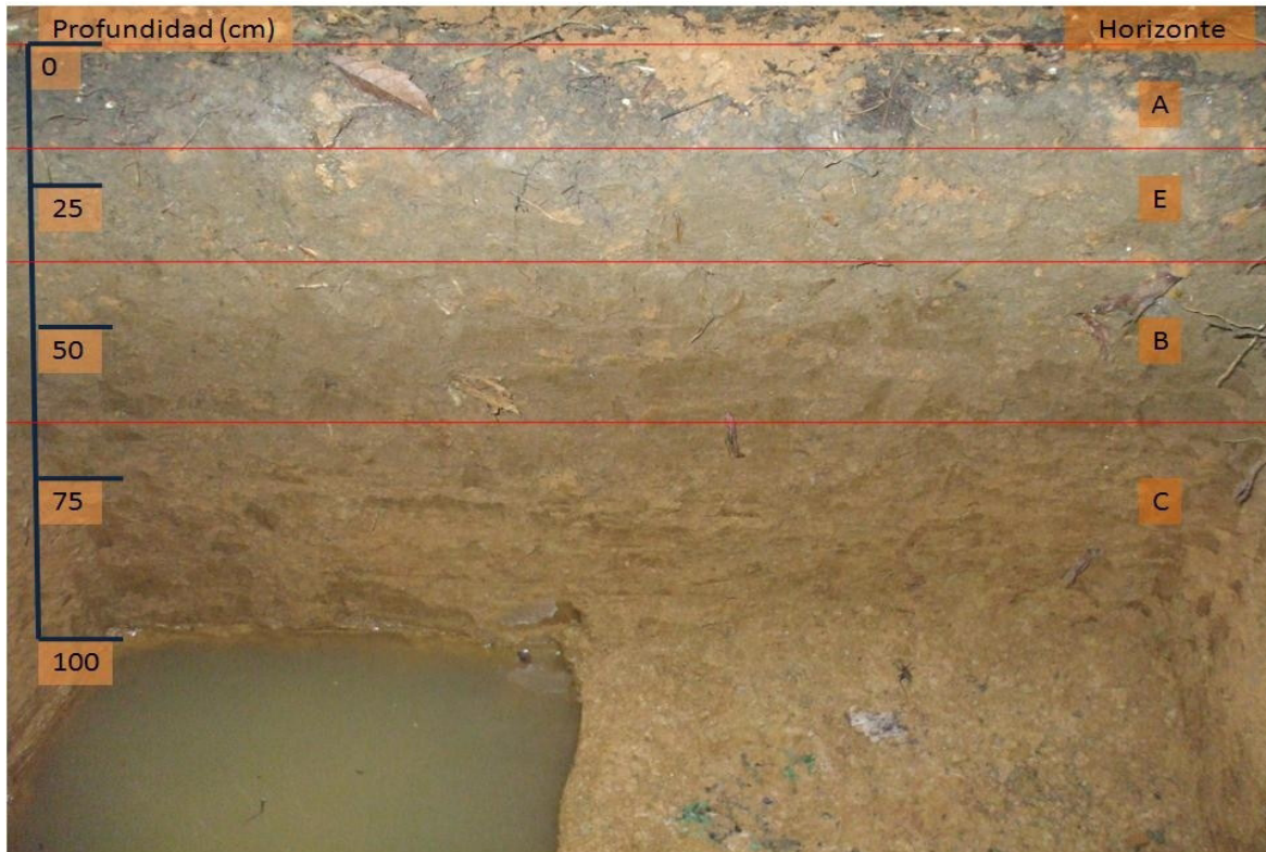
TABLA 1. Profundidad de horizontes, densidad aparente de suelo, pH y grosor de raíces >0.5 cm de diámetro presentes en cada horizonte de una calicata excavada en un bosque de Castilla elastica en El Tallonal, Arecibo, Puerto Rico.