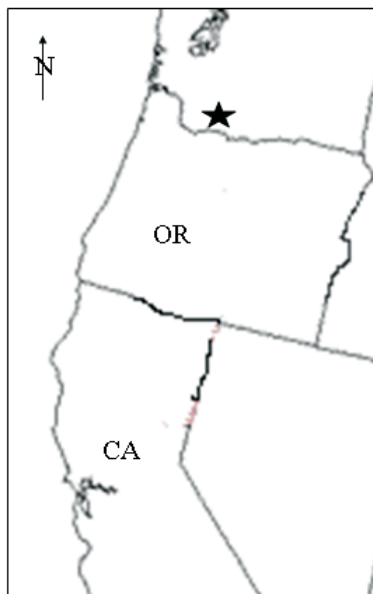
Figure 1 --Location of the study reserve (black star) in the northwestern United States. California (CA) is provided for reference.

Empezamos nuestro análisis registrando la estructura actual de la vegetación en la reserva utilizando fotografías aéreas de 1995 (escala 1:12000) Se interpretaron a través de fotografías los rodales de vegetación (159 en total) que compartían la misma estructura y composición, utilizando métodos de Hesburg y otros (1999) e introducidos en la base de datos Arc View R GIS. Se construyó una matriz resumida de dos atributos de rodales, tipo de estructura y vegetación potencial a fin de estratificar todos los rodales en 15 tipos de árboles (ver más detalles en Hummel y otros, 2001) Estos dos atributos combinados proporcionan información sobre la estructura forestal actual y las condiciones que influyen sobre su índice potencial de cambio. Para cada tipo de árbol se asignó un índice de gravedad de enfermedad de raíz utilizando métodos de (Goheen, 1997)